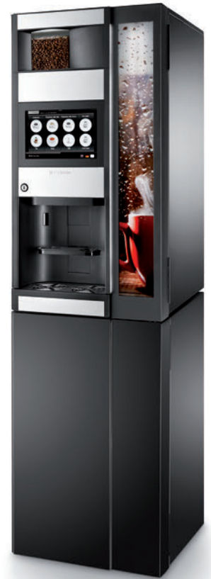
Der elegante Unterschrank passt perfekt zum Design der Maschine.